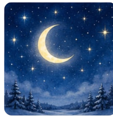
звёзды и месяц