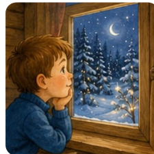
Виталик у окна