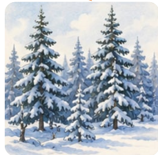
сосны и ели