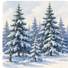
сосны и ели